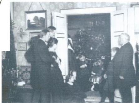
Se juletræet fra ca. 1888. Det er arkivets ældste julebillede. Juletræet var hos familien Petersen i villa Sovang i Alléen. Foto: Tårnby Stads- og Lokalkarkiv, B565

Mange julehilsner fra SundhedsCenter Tårnby